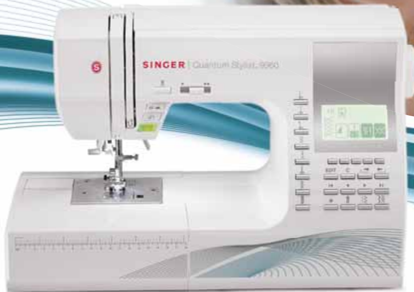
Quantum Stylist™ 9960